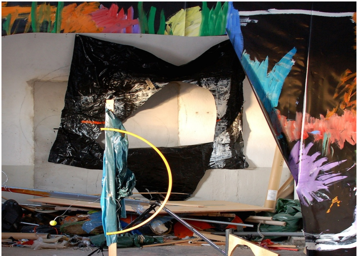
Sten Are Sandbeck