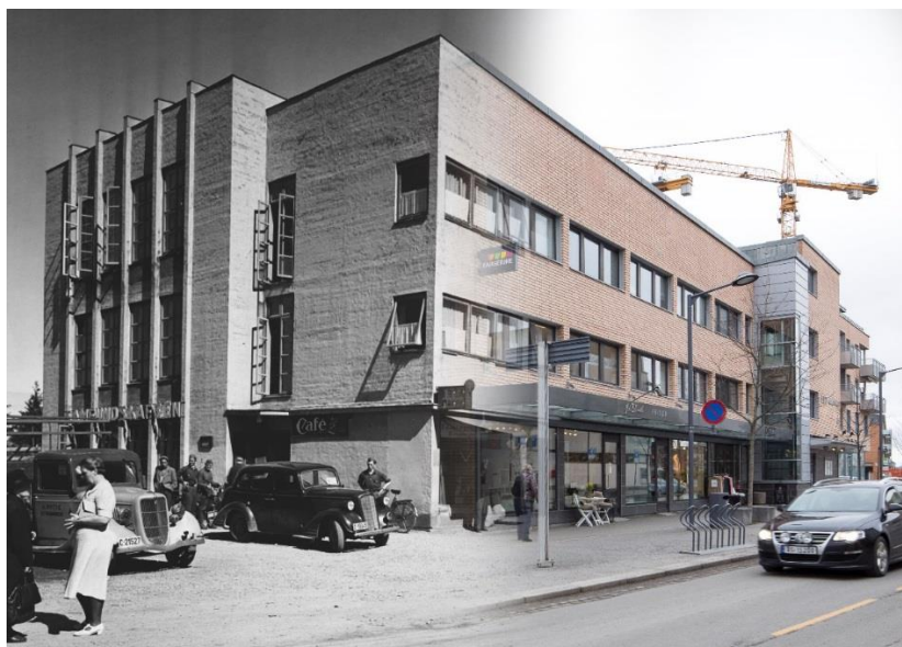
Folkets hus i Strømmen 1939 og 2017.